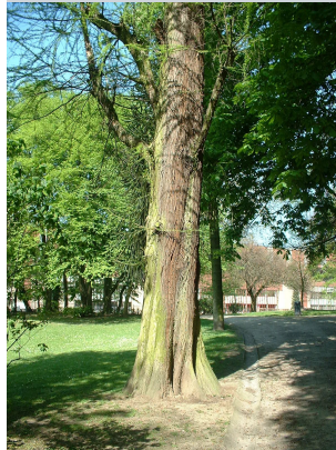
, 17 Avril 2003

* Ces critères sont pondérés de la manière définie dans la méthodologie .