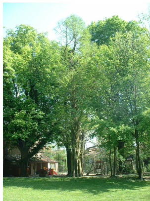
, 17 Avril 2003